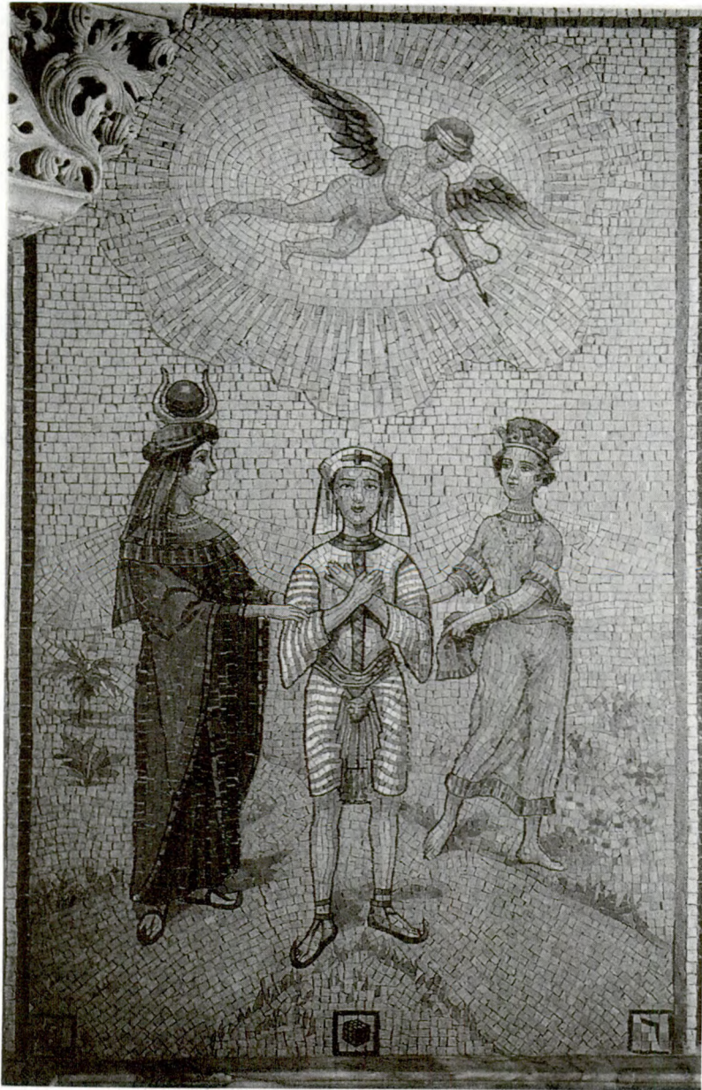
Il Tarocco n. 6: gli Amanti nella cappella del castello delle Avenières