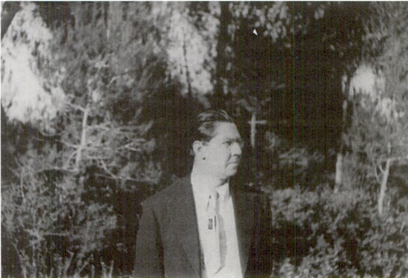
René Schwaller de Lubicz a Plan de Grasse