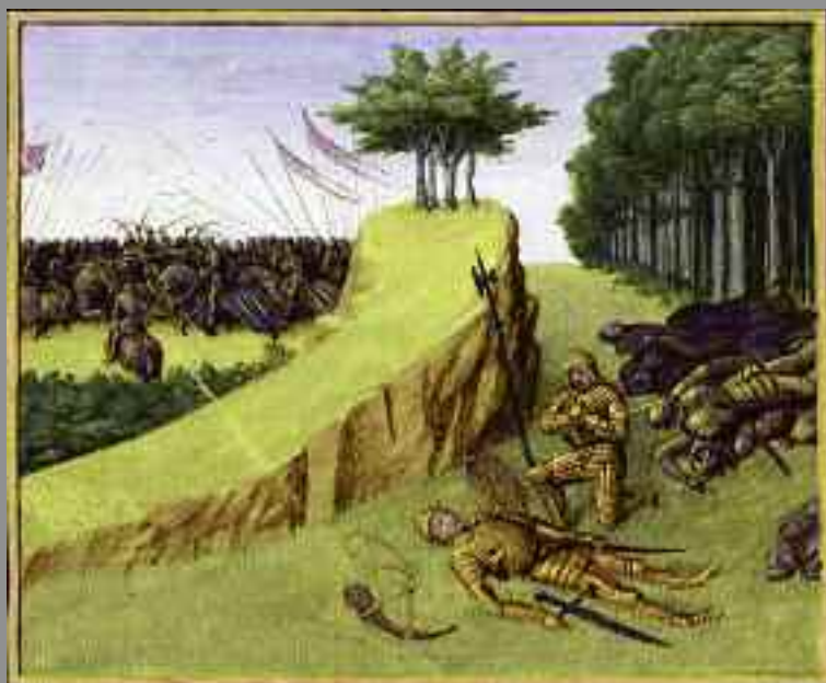
illustrazione tratta da The Story of King Arthur and his Knights di Howard Pyle (1902)

Sotto da sinistra: Prima pagina de "La Chanson de Roland" Manoscritto di Oxford